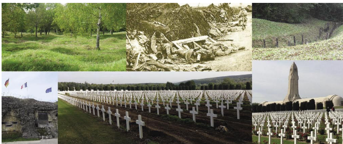
Bojišče pri Verdunu leta 1916 in danes. Pokopališče in kostnica v Douaumontu

1916. V 300-dnevnem klanju je bilo več stotisoč žrtev tako na francoski kot tudi na nemški strani. Nemška vojska, ki je mislila zasesti Francijo, je za obsežno vojaško ofenzivo izbrala Verdun, kajti tukajšnja trdnjava je imela simbolični pomen, skozi stoletja je branila Francoze pred vzhodnimi napadalci. Nemci so se zavedno odločili za Verdun, kajti, če bi na tem mestu premagali Francoze, potem bi jih strli tudi moralno. Še več, vzeli bi revanš za poraz v francosko-nemški vojni leta 1870. Bitka pri Verdunu je tudi simbol moderne vojne, v kateri se uporabljajo orožje in bojni strupi za masovno uničevanje. Navzočnost vojaške industrije prej nikoli ni bila tako očitna kot prav v verdunski bitki. Bitka je bila kot klavnica, v kateri je umrlo dnevno kakih šest tisoč vojakov. V ta pekel so poslali kakih 2,5 milijona vojakov z obeh strani. Če seštejemo tudi tiste žrtve, ki so umrle kasneje zaradi poškodb v tej bitki,