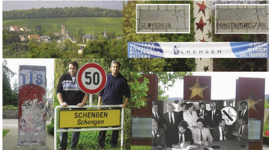
Schengen – zibelka Evrope brez meja

sva pripotovala iz preteklosti v sedanost, obenem iz vojne v mir. Veliko ljudi ne ve, da je Schengen mala vasica ob luksemburško-francosko-nemški tromeji. Toda ime ali pojem schengen pozna veliko ljudi, kajti pogodba pomeni odpravo kontrole na sami meji med tistimi državami, ki so del schengenskega območja. Posebno dobro poznajo to Porabci, ki so pozno doživeli odprte meje in prosti pretok ljudi in blaga. Tudi samo Porabje se nahaja ob tromeji in je bilo več deset let z železno zaveso odrezano od sosedov. Zahvaljujoč schengenski pogodbi sta postala Gornji Senik (Porabje na Madžarskem) in Martinje (Goričko v Sloveniji) taka soseda kot sta Gornji Senik in Dolnji Senik, ki sta v isti državi. Podobno bi lahko rekli za Dolnji Senik/Unterzemming (Madžarska) in Mogsersdorf/Modinci (Avstrija). Ljudje lahko brez ovir prestopijo iz ene države v drugo, hodijo nakupovat, se obiskovat, nekateri si pri sosedih najdejo službo ali šolo... Spoznajo drug druge-