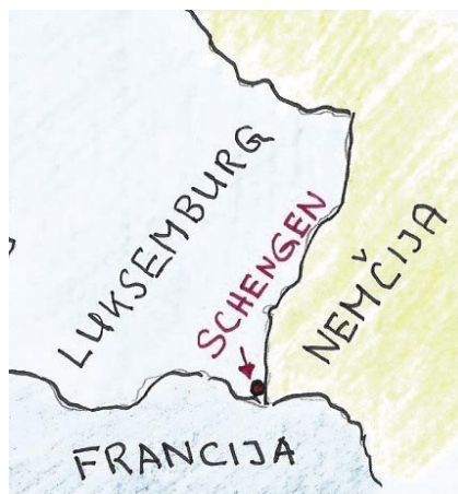
Vasica Schengen se nahaja pri tromeji Luksemburga, Nemčije in Francije

Konvencija o izvašanju schengenskega sporazuma je bila podpisana leta 1990 prav tako v vasi Schengen, danes velja že skoraj v vseh državah članicah EU. V 20. stoletju je v Evropi umrlo več milijonov ljudi zaradi vojn, zaradi njih je zbežalo s svoje domovine ogromno ljudi. V Schengenu sva se zamislila in sva zračunala, da v Evropi – razen državljanske