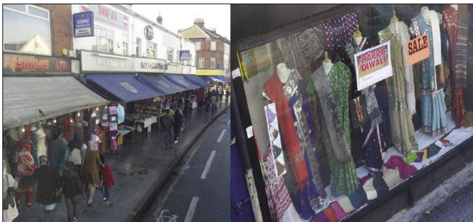
Glavna ulica v Southallu, kjer samo vreme in arhitektura spominjata na Anglijo

nad zlom, zmago svetlobe nad temo, obenem je pa zavedanje človeka o lastnih krepostih. V tem letu so začeli Diwali praznovati 13. novembra. Po hindujskem koledarju se začenja praznovanje zmeraj na 15. dan meseca, ki ga oni imenujejo