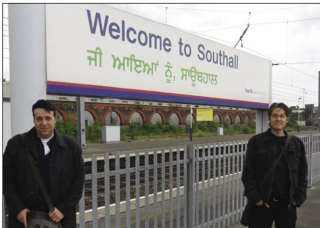
Avtorja članka pred dvojezičnim napisom

sva se sezula, si umila roke in obraz, s tem dokazala, da spoštujemo njihovo tradicijo. Vsi so bili zelo vljudni in prijazni z nama. Sikhovstvo in Sikhi so zelo tolerantni. Njihov tempelj, ki se imenuje Gurdwara, kar pomeni vrata h Guruju, je odprt za vsakega, ne glede na njegovo narodnost ali vero.