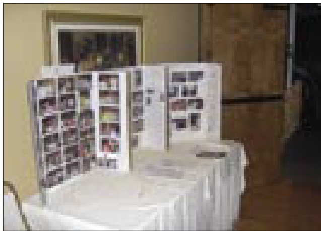
Mala razstava fotografij, gde so pokazali prejšnja srečanja