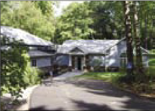
V tom lejpom kraji je bilau srečanje Prijateljskoga društva Murska Sobota-Bethlehem

Prijateljsko društvo Murska Sobota-Bethlehem vsakšno leto ma geseni srečanje. Lansko srečanje je bilau v idiličnom kraji