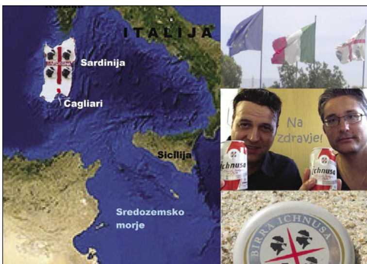
Otok Sardinija je del Italije

Sardinija ne privlači turistov le s svojo bogato zgodovino in lepimi pokrajinami, ki te spodbujajo k individualnemu potepanju, ampak je znana tudi po svojih krasnih, čistih morskih obalah, ki jih večkrat primerjajo s karibskimi plažami. Na vzhodu mesta Cagliari se nahaja ena najdaljših plaž v Italiji, »Poetto«, ki je dolga 10 km. Zanimivo je bilo, da so se na tej plaži kopali in sončili predvsem domačini, turisti bolj redko. V velikem številu pa so bili ljudje, ki niso bili ne domačini ne turisti, ki na to plažo niso prišli počivat,