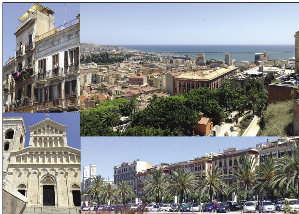
Glavno mesto otoka, Cagliari

Ko sva prispela v glavno mesto Sardinije, Cagliari, sva ob italijanski in unijski zastavi takoj opazila tretjo, precej ne navadno zastavo. Bela osnova je razdeljena z rdečim križem na štiri polja, v vsakem polju je črnska glava s trakom preko las. Zastavo Sardinije sva